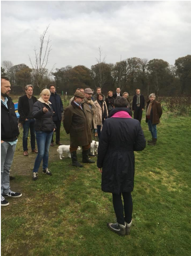
Vrienden op Vijversburg

Op 3 november 2017 is een informele vriendenbijeenkomst georganiseerd op Park Vijversburg te Tytsjerk. Het verslag is hier te lezen.