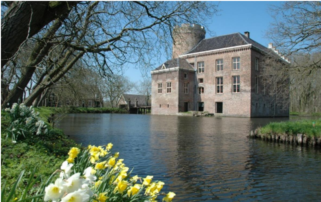
Kasteel Loenersloot