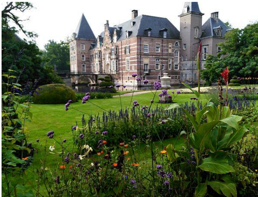
Kasteel Twickel

In 2014 maakte de VPRO een documentaire over Paleis Het Loo, waarin ook de Vrienden en vrijwilligers aan het woord zijn. Zie hier de documentaire.